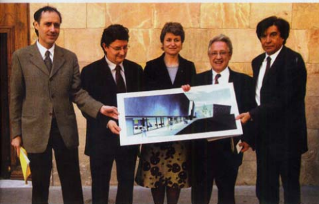
Firma del convenio CENTRE ESPLAI

de naturaleza y un espacio de formación para el desarrollo asociativo. Además, este edificio acogerá las oficinas de la nueva sede de la Fundació, a las que cada día se desplazarán 180 personas.