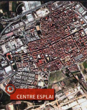
Localització del Centre Esplai

El Grupo Infantil Sant Cosme (GISC) lleva más de treinta años desarrollando su tarea educativa en el barrio. Es miembro del MOVIBAIX, de la Federación Catalana de l'Esplai y, por tanto, también de la Fundació Catalana de l'Esplai.