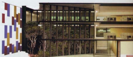
Secció del edifici.

El Grupo Infantil Sant Cosme (GISC) tiene su sede en el antiguo Centro Social en la Plaça del Barri y su horario de atención es por las tardes, de 16 a 20 horas de lunes a viernes.