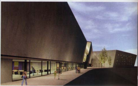
Imagen virtual de CENTRE ESPLAI