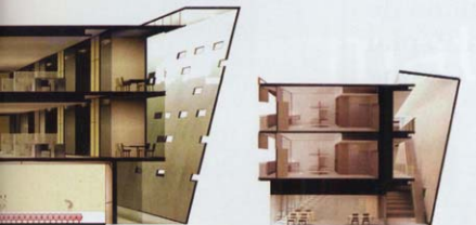
Oficinas, sala de actos, espacio del Delta