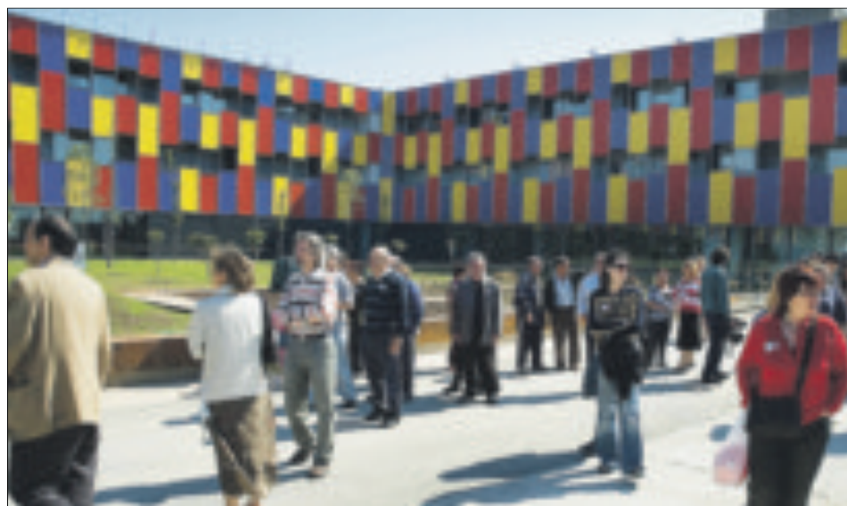
Centenars de veïns van participar en la inauguració del Centre Esplai, ahir, al Prat de Llobregat.

Les noves i vistoses instal·lacions (foto), obra de l'arquitecte Carlos Ferrater, ha de suposar una empena per al barri de Sant Cosme, al Prat.