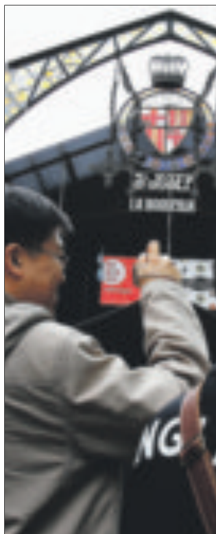
Les postals de la Rambla de Barcelona mostren un espai divers i aglutinador de cultures.

cions i institucions. Els ciutadans poden participar-hi a www.laramblabcn.com .