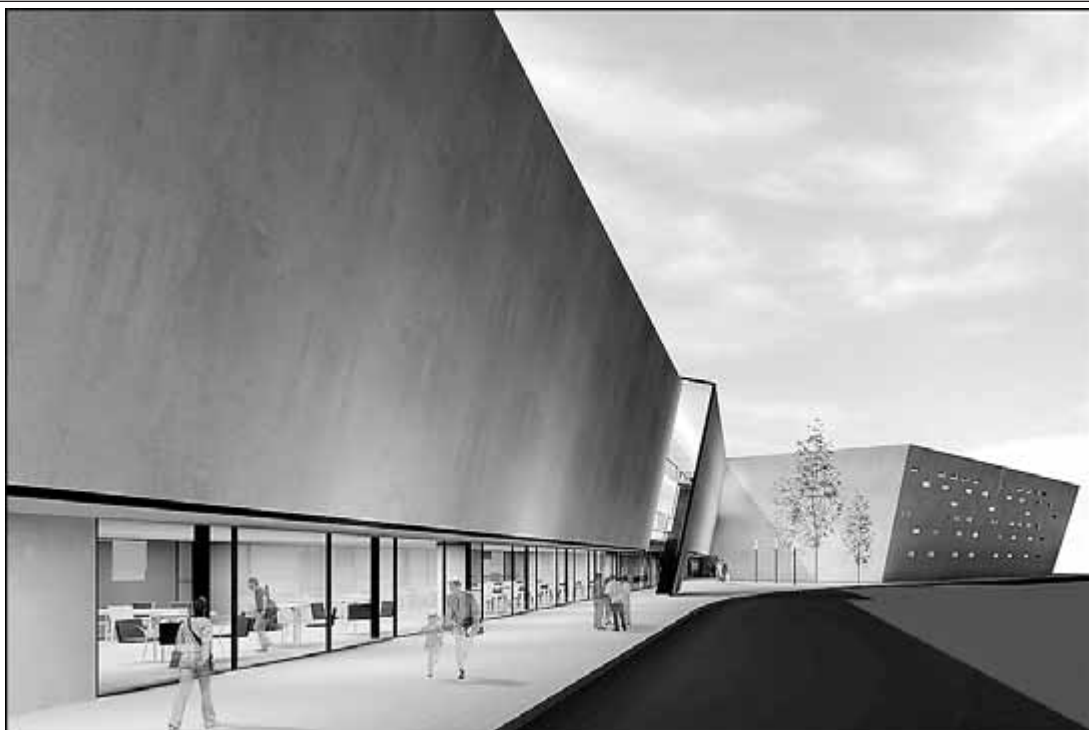
Imatge virtual de la futura seu de la Fundació Catalana de l'Esplai